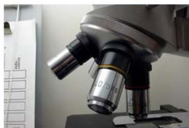
Une allocation pour financer votre thèse sur le littoral

Afin de favoriser la recherche sur le littoral, le Syndicat Mixte de la Côte d'Opale (SMCO) propose un dispositif de financement de 5 allocations de recherche d'une durée de 3 ans.