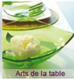
Arts de la table